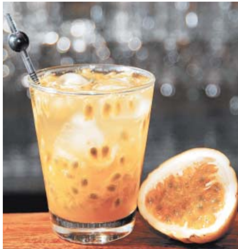
SALADA DE FRUTAS – Bares apostam em outros sabores como lima de pérsia, morango, maracujá (Bar Piratininga) e mista (Baretto)